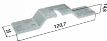
2× dverný nosič