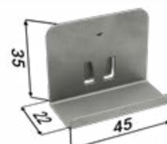
6× nosič SDK