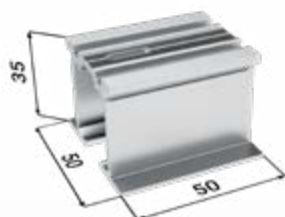
1× doplnok koľajnice