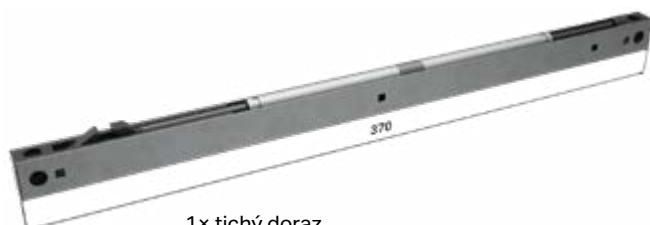
1× tichý doraz

• Čisté prechodné rozmery stavebného puzdra