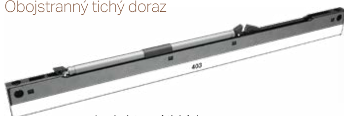
1× obojstranný tichý doraz