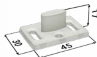
1× vodiaci trň